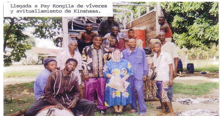
Llegada a Pay Kongila de víveres y avituallamiento de Kinshasa.

Pero nuestra desdicha es que hace 20 años compramos varias hectáreas para hacer una granja de vacas, pagamos al dueño de la tierra sus derechos y al poco tiempo observamos que los animales se morían y multiplicaban muy mal, indagamos y resultó que el dueño tenía un hermano con el que se disputaba las tierras y por las noches mandaba gente para que quemasen los pastos de nuestras vacas, les ponían hierbas